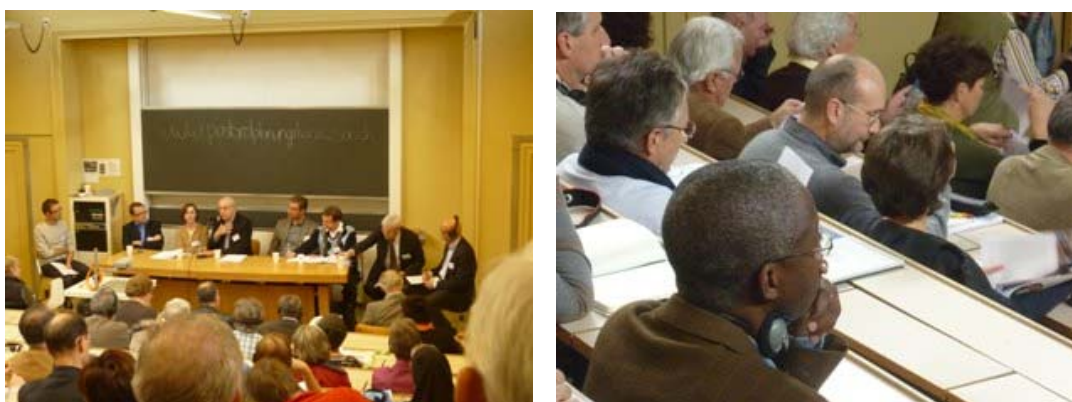
Participant(e)s de la journée d'étude de la table ronde

La prochaine journée commune d'études publique CPP - IKO est prévue pour 2013.